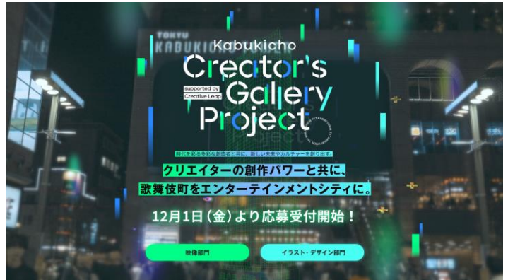
▲ Kabukicho Creator's Gallery Project イメージ

※本プロジェクトの詳細は、特設サイト( https://creators-gallery.jp/ )をご確認ください。