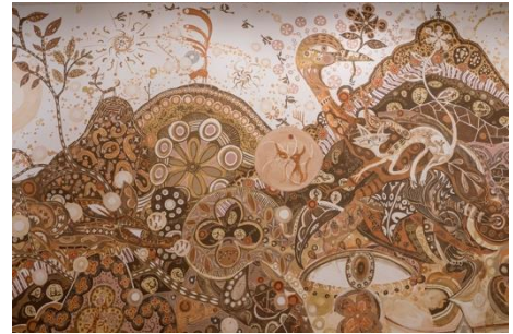
▲参考画像『yamatané』 2014, Rice Gallery(ヒューストン、米国)での展示 ©Yusuke Asai

1981年東京生まれ。土、水、埃、テープ、ペンなど身近な素材を用い、旅のチケットやコースターの裏に描かれたドローイングから巨大壁画まで様々なスケールで奔放に絵を描き続ける。大きな生き物の中に入れ子状に小さな動植物が現れるなど、ミクロの中にマクロが存在する生態系を表すような独特の表現は国内外で評価が高く、展覧会や芸術祭にも多数参加。2019年横浜文化賞 文化・芸術奨励賞受賞。