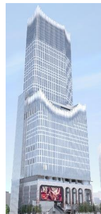
▲本施設外観イメージ

歌舞伎町エリアにかつて川が流れていたことや、現在でも歌舞伎町弁財天が水を司る女神として祀られていることから、本エリアの根源的な要素である「水」を外観モチーフ「噴水」として継承しています。歌舞伎町の根底に流れる水のエネルギーが噴水のように天に伸びる姿や、水の持つ純粹さ、常に変化する柔軟さ、透明な水・白い水飛沫が多層に重なり合う優雅な姿を表現したデザインとなっています。日本で「水」を意味する文様「青海波」を導入し、窓のセラミックプリントや低層外壁アルミキャスト、アーチ窓などで表現しています。