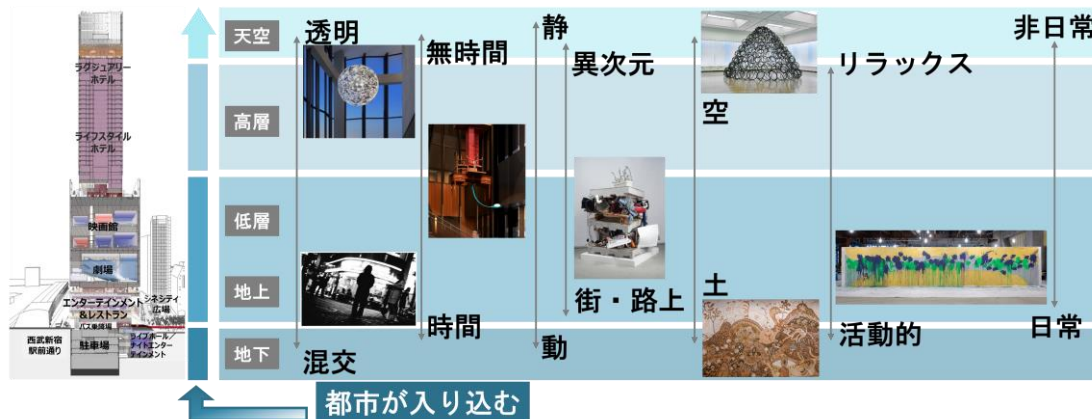
▲作品ゾーニングイメージ

展示作品は、低層付近では「混交、時間、動、街・路上、土、活動的、日常」を、高層部では「透明、無時間、静、異次元、空、リラックス、非日常」をテーマとし、地下から地上約225mに伸びる建物との親和性を表現したゾーニングとすることで、本施設内に都市が入り込み、本施設と新宿・歌舞伎町が一体となることを目指します。さらに、アート作品の展示だけでなく、アートツアーやホテルとの連動企画を実施することで、偶発的な都市文化体験を可能とし、新たなアート体験価値を提供します。