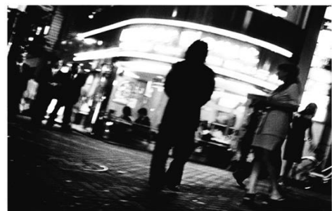
▲Untitled、『新宿』シリーズより 2002、ゼラチンシルバープリント、printed later ©Daido Moriyama

半世紀以上にわたり新宿という街に魅せられてきた森山大道氏。わい雑と混沌に満ちたエネルギッシュな街、新宿の夜を撮影した代表的な作品集『新宿/Shinjuku』から作品を厳選し、本施設1階エントランスほかに複数展示する。都市の欲望や身体性をあまねく捉える路上からの視点は、唯一無二の独創性に富んでいる。