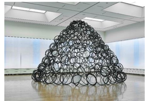
▲参考画像 『霧と鉄と山-I』 2019年 鉄、ガラス、波板 府中市美術館での展示

1958年東京生まれ。1980年代より鉄を素材とした彫刻を制作。素材本来の硬質感や重量感、あるいは彫刻の従来のイメージから離れ、シンプルな素材、技法ながら、作品の置かれる場、空間全体を意識した作品を生み続ける。その革新的な実践は高く評価され、美術館での個展、コレクション多数。近年はガラス、石膏、石鹸など、さまざまな素材に取り組んだ作品を発表している。