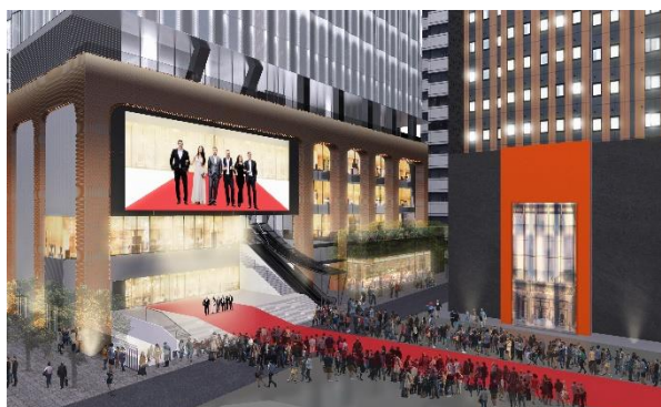
▲シネシティ広場と連動したイベントイメージ(映画イベント)

歌舞伎町一丁目地区開発計画(新宿TOKYU MILANO再開発計画)では、東急歌舞伎町タワーの整備と合わせて、まちづくりへの貢献として、空港連絡バスの乗降場整備や、西武新宿駅前通りのリニューアルなどを実施するとともに、隣接するシネシティ広場を中心とした公共空間と本施設が一体となったエリアマネジメントを地域団体と連携して実施し、まちの回遊とにぎわいを創出していきます。