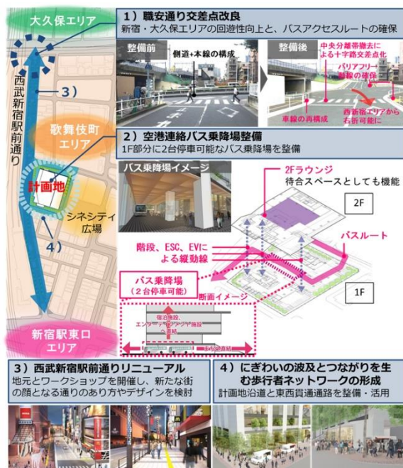
▲まちづくりへの貢献