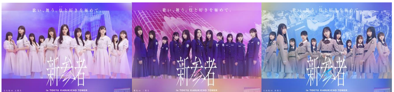
左から乃木坂46 五期生、櫻坂46 三期生、日向坂46 四期生

乃木坂46 五期生、櫻坂46 三期生、日向坂46 四期生 という坂道シリーズ3グループの「新参者」たちによるライブ公演が決定！