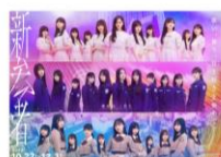
メンバーメッセージカード (※裏面にメッセージが入ります)