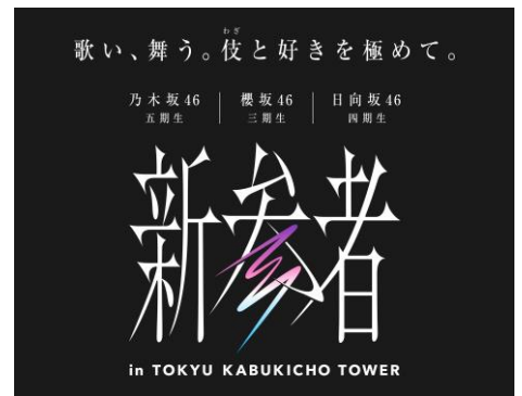
▲「新参者 in TOKYU KABUKICHO TOWER」施策ロゴ

本施策は、2023年10月27日(金)からの順次開始を予定しており、今回は劇場、ライフスタイルホテル、映画館、飲食テナント、およびECサイトでの展開を発表します。