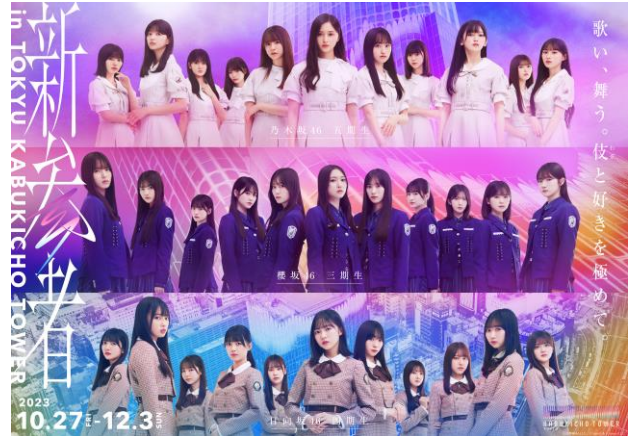
▲「新参者 in TOKYU KABUKICHO TOWER」キービジュアル

今般、本施設全体でコラボレーションを行う“好きを極める”施策として、乃木坂46 五期生、櫻坂46 三期生、日向坂46 四期生とともに「新参者 in TOKYU KABUKICHO TOWER」（以下、「本施策」）の実施とそのキービジュアルが決定し、本施策オフィシャルサイトがオープンしました。合わせて、本施策の各用途での展開と予約に向けた詳細を公開します。