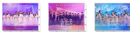
ミニキャンパスボード