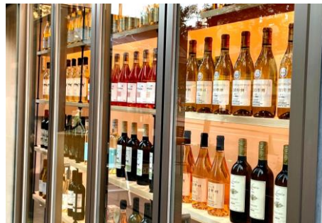
▲Wine Wall KABUKICHO by BON LUMIERE 外観