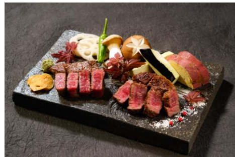
▲Kobe Beef Dining 和牛特区 「旬菜と神戸牛二種食べ比べステーキ」