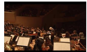
『Playing the Orchestra 2014』