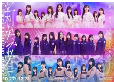
乃木坂 46、櫻坂 46、日向坂 46 とのコラボレーション 「新参者 in TOKYU KABUKICHO TOWER」

また、本施設上層階に位置する2ブランドのホテル(BELLUSTAR TOKYO, A Pan Pacific Hotel、HOTEL GROOVE SHINJUKU, A PARKROYAL Hotel)についても客室は高稼働で推移し、インバウンドのお客さまを中心に国内外のお客さまにご利用いただいています。