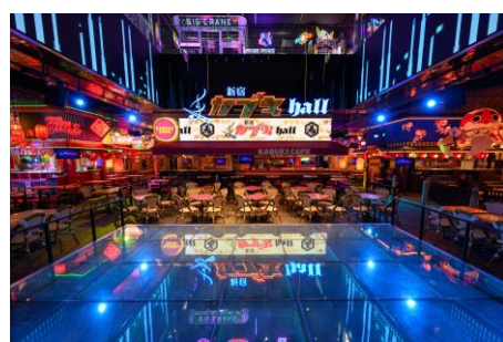
2階ステージでのカラオケ大会