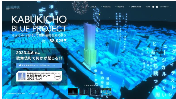
▲キャンペーン終了後の特設サイト