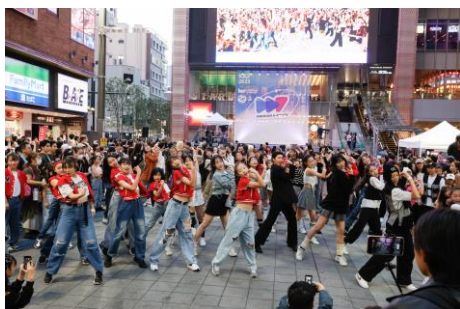
K-POP ランダムプレイダンス

4月13日(土)、14日(日)の2日間、この1年間で実施してきたイベントの中で特にお客さまからの人気が高かった内容をセレクトし、2日間に詰め込んだスペシャルイベント「TOKYU KABUKICHO TOWER 1st Anniversary スペシャルライブ」を開催します。ゴスペル、Kabukicho Music Live、DJといった音楽パフォーマンスから、K-POPランダムプレイダンスや阿波踊り、デジタルアートバトル、さらに2日間の締め括りにはご来館いただいたお客さまにもご参加いただける「カラオケ大会」も開催予定です。タイムスケジュールや出演アーティスト情報は、特設サイトをご確認ください。