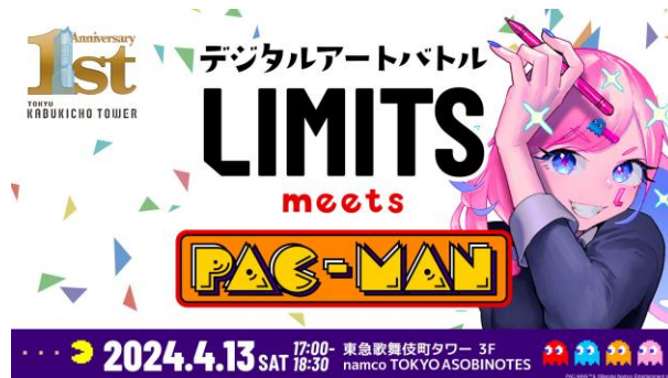
LIMITS (デジタルアートバトル)

【イベント詳細ページ】 https://www.tokyu-kabukicho-tower.jp/special/?spcd=000022