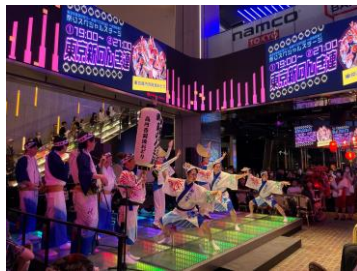
本施設2階ステージ お祭りイベントの様子