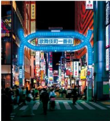
▲歌舞伎町一番街アーチ青色点灯イメージ

本施設開業に向け、2023年2月24日から4月27日まで「KABUKICHO BLUE PROJECT」を実施しました。主な取り組みとして、デジタル施策「#好きがつかないでくれたキャンペーン」を実施。「KABUKICHO BLUE FESTIVAL」が開催され、デジタル施策で集めたみんなの「好き」に連動して歌舞伎町が青く染まりました。お客さまに歌舞伎町の回遊を楽しんでいただいたほか、投稿されたメッセージにちなんだ映画イベントや音楽イベントが展開されるなど、デジタルとリアルが連動した施策を展開しました。