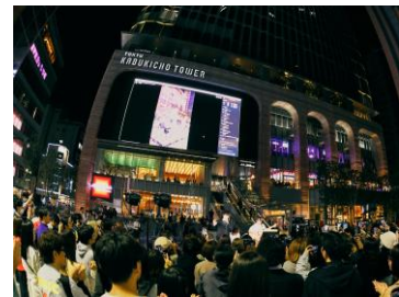
Kabukicho Music Live の様子(歌舞伎町シネシティ広場)

今般、お客さまに日頃の感謝の気持ちを込めたイベント「TOKYU KABUKICHO TOWER 1st Anniversary」の開催が決定しました。音楽・ダンス・お祭りなど、この1年間で実施してきたイベントの中で特にお客さまからご好評いただいた内容を2日間に盛り込んだスペシャルライブや BELLUSTAR TOKYO の最上級客室であるペントハウスの宿泊券(夕朝食付)など超豪華な賞品が当たるキャンペーンを実施します。実施の概要は以下の通りです。